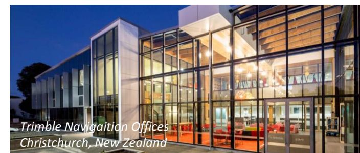
Trimble Navigation Offices Christchurch, New Zealand

Le prime applicazioni sono state studiate presso l'Università di Canterbury a partire dal 2005 e dalla Università della Basilicata dal 2010. Attualmente in Nuova Zelanda si registrano le prime realizzazioni di edifici con la tecnologia Pres-Lam™ a strutture reali.