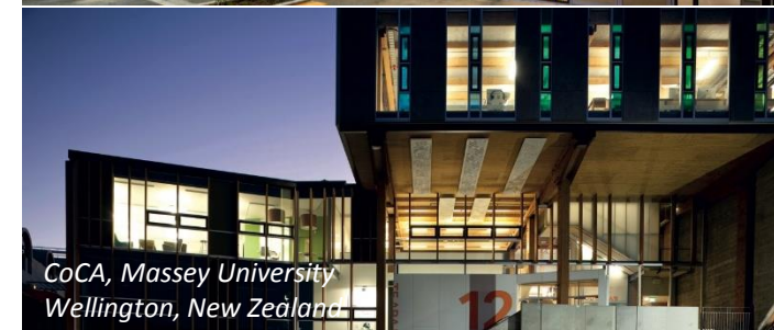
CoCA, Massey University Wellington, New Zealand