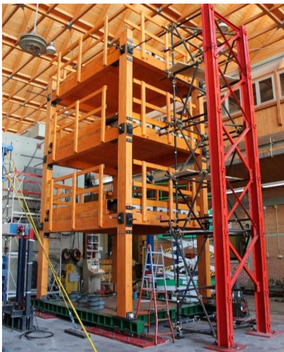
Modello Sperimentale Pres-Lam™ Laboratorio Prove Materiali e Strutture Università degli studi della Basilicata

Al termine degli interventi tecnici verrà mostrata, a scopo dimostrativo, una prova su tavola vibrante del modello sperimentale disponibile presso il Laboratorio Prove Materiali e Strutture dell'Università della Basilicata.