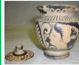
Krateriskos apulo a figure rosse, fine IV sec. a.C., da Anzi, loc. Costaro.

Nel V sec. a.C. l'espansione dei Lucani, un popolo di stirpe sannitica, sconvolse il quadro insediativo della Basilicata antica. Dopo aver conquistato la città greca di Poseidonia (Paestum) sul Tirreno, essi si spinsero verso la costa