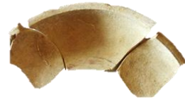
Piatto frammentario con decorazione geometrica bicroma, VI sec. a.C., da Anzi, loc. Potente.

Il quadro insediativo nella Basilicata di VII-VI sec. a.C. appare molto articolato, come testimoniano le fonti storiche e l'archeologia. Mentre sul litorale ionico fiorivano le colonie greche di Metaponto e Siris/Eraclea , la Basilicata meridionale interna era occupata dagli Enotri e la fascia sud-est dai Chones . Nelle restanti aree – di cultura iapigia (apula) – si possono distinguere tre diverse popolazioni: i Peuceti, nelle valli del Bradano e del Basento, i Dauni, nel Vulture-Melfese, e una popolazione nord-occidentale, talora identificata con i