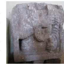
Busto funerario di statua romana di togato, da Anzi

Verso la fine del III sec. a.C., in seguito sanguinose battaglie, il processo di conquista della Lucania da parte dei Romani si può considerare concluso. Capisaldi dell'egemonia militare e politica della nuova potenza furono le fondazioni di Venosa e di Grumentum . L'organizzazione insediativa e le dinamiche socio-economiche di età romana segnarono pesantemente il territorio regionale, ora caratterizzato da una scarsa urbanizzazione e dalla gestione in regime latifondistico di sue ampie porzioni. Fino all'epoca tardo-antica (IV-V sec. a.C.) un particolare rilievo ebbero le enormi proprietà di ricchi possessores , talvolta di rango senatorio o imperiale, documentate dalla presenza di sontuose ville dotate di parte residenziale e produttiva.