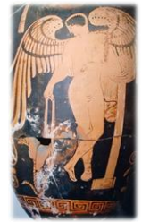
L'immagine simbolo della mostra è tratta da un'anfora lucana a figure rosse da Anzi, loc. Ischia, 350-330 a.C.

L'esposizione si chiude con un'animazione tratta dal dramma eschileo delle Coefore, che spesso compare sulla ceramica figurata di età lucana e che decora anche alcuni vasi anzesi, e con una prima complessiva presentazione dei reperti archeologici che, rinvenuti ad Anzi, sono oggi dispersi in numerosi musei di tutto il mondo.