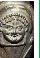
Londra, British Museum. Statua bronzea di cavaliere, V sec. a.C., da Anzi (particolare della ginocchiera con testa di Medusa)

Le numerose antichità provenienti da Anzi, ancora rintracciabili nei più importanti musei d'Italia e del mondo, rappresentano uno dei complessi archeologici più consistenti della Basilicata antica. Nell'approfondimento digitale dedicato a questo tema il visitatore potrà fare un giro del mondo virtuale alla ricerca di quei reperti, qui per la prima volta presentati in un corpus unitario.