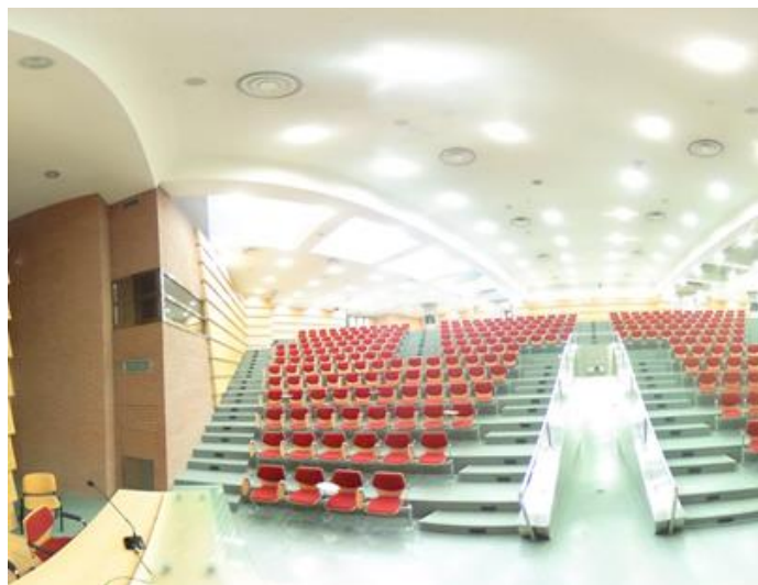
Aula Magna Università della Basilicata - Campus di Macchia Romana